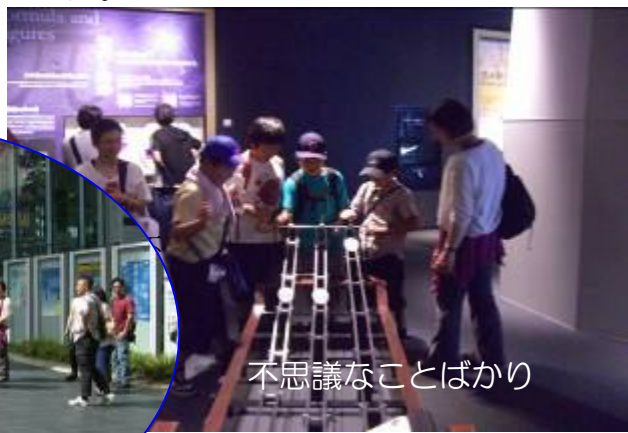
不思議なことばかり