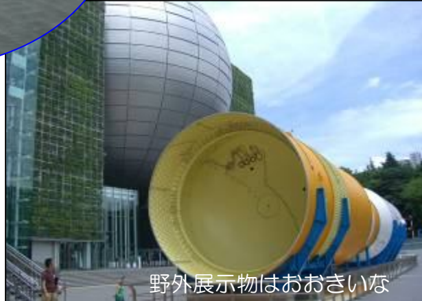
野外展示物はおおきいな