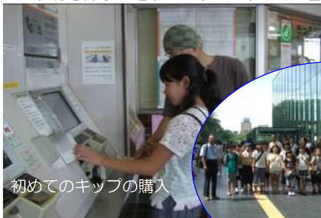
初めてのキップの購入

世界最大のプラネタリウムドームのブラザーアースでは、満天の星がふりそそいでいました。マイナス30℃の極寒ラボや竜巻ラボ、野外の大型展示にビックリ。戸惑いながら初めて買ったキップで、行き帰りの電車にも乗った楽しい大冒険の一日でした。