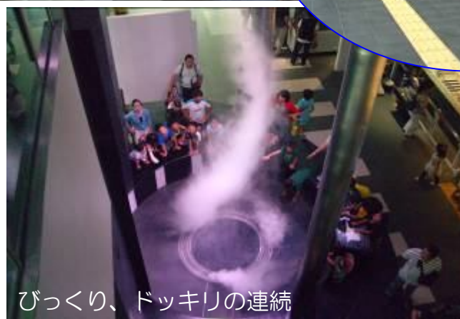
びっくり、ドッキリの連続